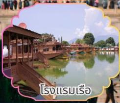
โรงแรมเรือ